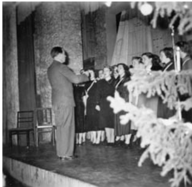
"HOL, perinteellinen pikkujoulutunnelman kohottaja" kehaisi Hälläpyörä 1952 haukuttuaan edellisvuonna kuoron hajaannuksen partaalle.