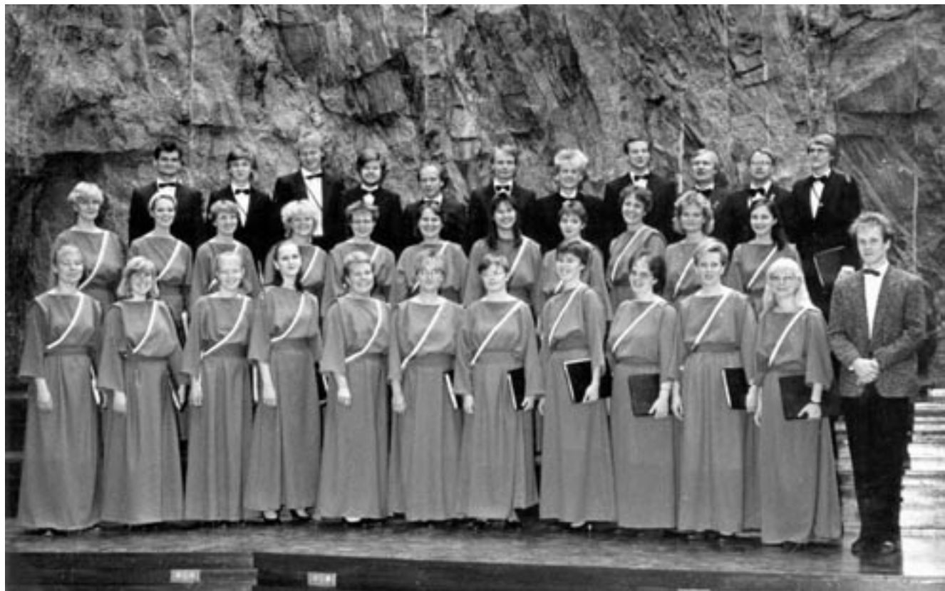
Naiset poseeraavat ylpeinä uusissa, punaisissa kuoropuvuissaan keväällä 1986 Tempeliaukion kirkossa.

tytöt kantoivat harjoituksiin kangaspaloja, puvun malleja ja ompelukoneita. – – Sitten seminaarihuone muutettiin muutamaksi päiväksi ompelusalongiksi ja iloinen säksätyks kuuluu onnettomien opiskelijoiden korviin. Pöydät oli siirretty seinille ja lattialla nuohosi polvillaan innokkaita ja sapekkaita kuoron tyttöjä punaisten kankaiden sekamelskassa. HOLin omaa designia edustaneet puvut valmistuivat tv-lähetyksestä edeltäneenä yönä, mutta vaiva kannatti ja hollilaiset erottuivat edukseen 500 kuorolaisen massasta. Yleisön kiittämät osakuntanauhanpunaiset