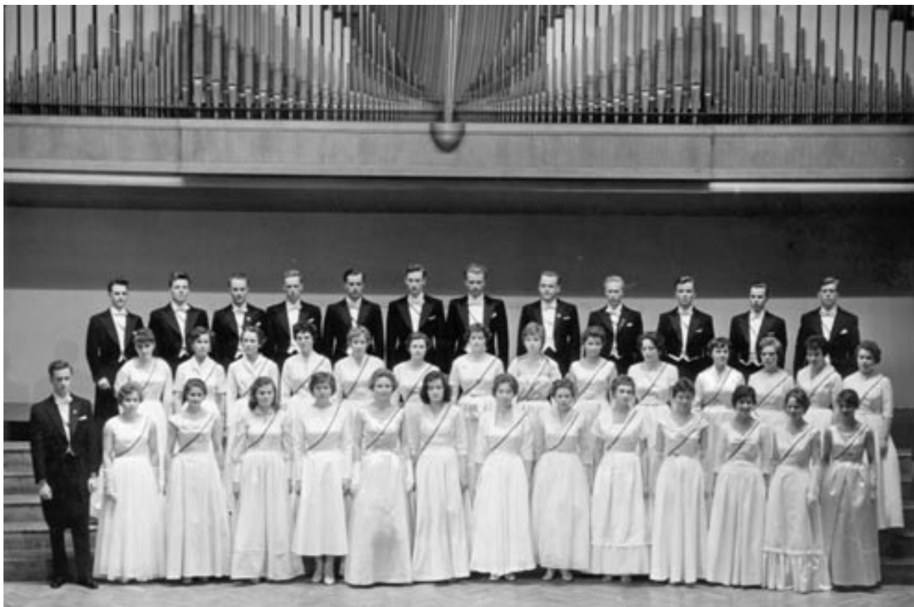
HOL 30-vuotisjuhlakonsertissaan. Perusteellisen neuvottelun jälkeen naiset olivat päätyneet pitkään kokovalkoiseen asuun.

sovinmaisempaa forte-tyylistä linjaa”. Kriitikot kiittivät laulun puhtautta, täsmällisyyttä ja notkeutta, ja vain latteita tenoreita moitittiin. Myönteisin oli Hufvudstadsbladet: Kuorolla on ollut onni saada johtaja, jolta voi odottaa parasta, jopa koko musiikkielämämme kannalta. Lассon tunnetun Echon kaikuäänet laulettiin lavalla, ei käytävällä (tuskin uskoi korviaan tai silmiään!) Jos laulajat pystyisivät oppimaan eri kielten oikeamman ääntämistavan, kannattaisi tämä kuoro lähettää ulkomaille. Mutta silloin tarvitaan lisää miesääniä!