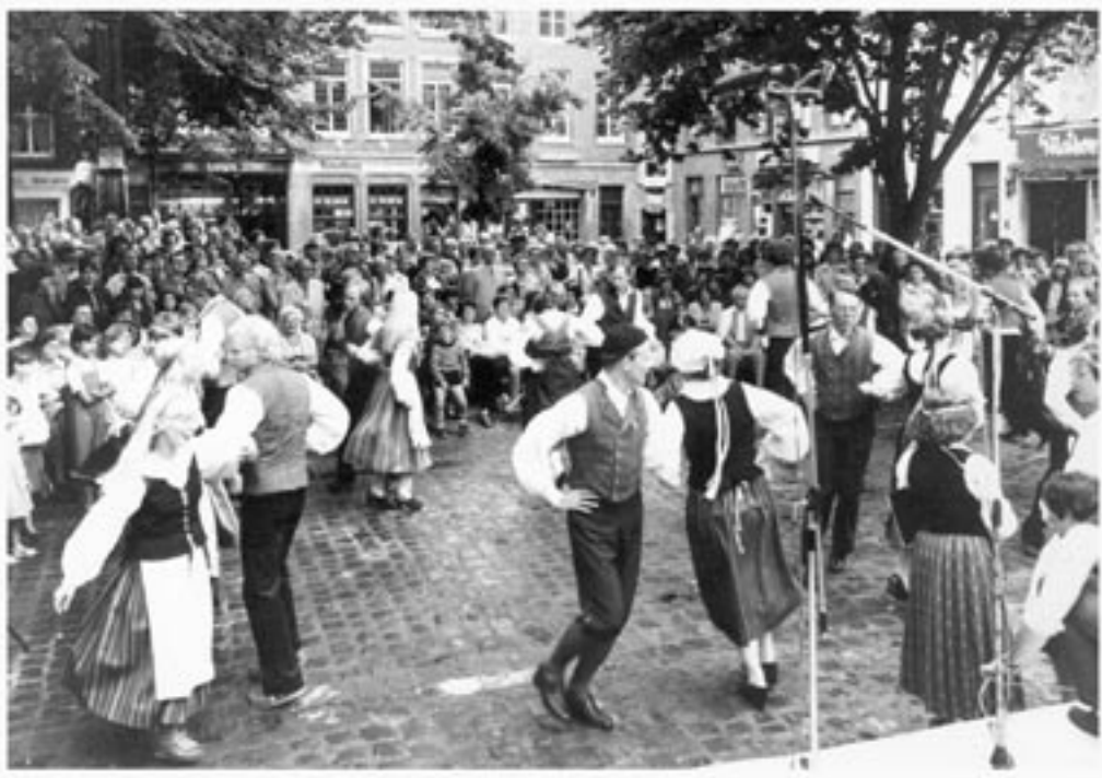
Europa Cantat -festivaalilla Namurissa Belgiassa 1982 HOL yllätti torikonsertin yleisön tanhunumerolla.

HOL osallistui Europa Cantat -festivaaliin ensi kerran Luzernissa 1979, ihastui ja on siitä lähtien käynyt joka festivaalilla usein ainoana suomalaisena kuorona. HOL oli kauan Euroopan nuorisokuoroliiton ainoa suomalainen suora jäsen (SULASOLin kuorot ovat jäseniä liiton kautta). Europa Cantat tarjoaa hollilaisille kotimaassa harvinaisen mahdollisuuden laulaa monisatapäisessä kuorossa suuria kuoro-orkesteriteoksia kuten Brittenin War Requiem, Elgarin Gerontiuksen uni, Schubertin Es-duurimessu ja de Fallan Atlántida. Joka kerran HOL on pitänyt oman konsertin ja esitellyt suomalaista kuoromusiikkia kansainväliselle yleisölle. Neversissä vuonna 2000 HOL sai kunnian esiintyä kaikille festivaalin 3 000 osallistujalle jättikonsertissa.