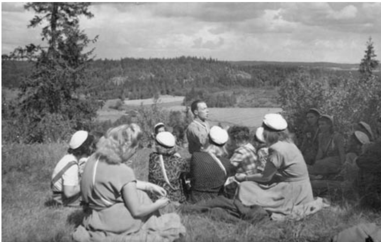
HOL ja Julle Suomi-filmien tunnelmissa Hakoisten linnavuorella Janakkalan kesäjuhlilla 1951.

toiminta on jäänyt laimeaksi. Pohdittaessa syitä siihen todettiin, että kuorotoiminnassa, osakuntien piirissä toimivissa kuoroissa semminkin, on aina lasku- ja nousukausia. Eräänä syynä tässä tapauksessa mainittiin Hälläpyörässä esiintyneet hyökkäävät HOL:iin kohdistuneet kirjoitukset syksyllä 1951, jotka ovat aiheuttaneet innon laimenemista sekä vanhoissa jäsenissä että haitanneet uusien mukaan saamista. Samanlaista epäasiallista arvostelua ja oppositioasenteita on havaittu muuallakin kuin Hälläpyörän palstoilla. Kritiikki sinänsä ei ole pahasta mutta esitettyinä epäasiallisin perustein ei ole omiaan innostamaan.