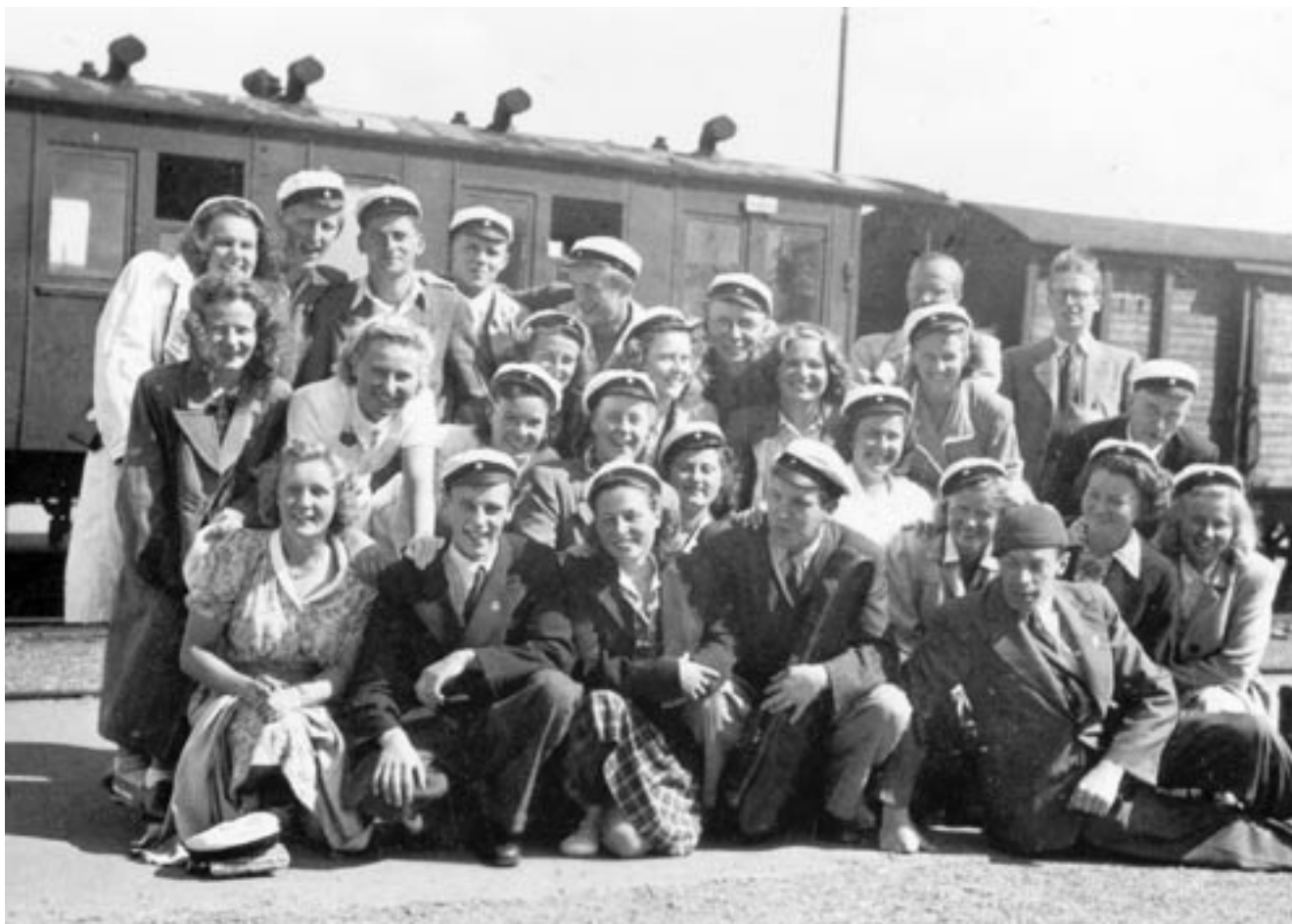
Hollilaiset Toijalan asemalla lähdössä kiertueelle kesällä 1947.

tuksensa mukaan. – – Osakuntanauha ja laulumerkki tietysti koristivat rinnuksiamme. Hän muistelee myös asuntopulan vaikutusta tunnollisen kuorolaisen taiteelliseen työhön: Kotiharjoittelu ei käynyt laatuun opiskeluboksin emäntien takia. Edellytettiin absoluuttista hiljaisuutta asunnossa, ja Helsingissä oli valtaisa asunto- ja boksipula. Akateemista kilpailua varten harjoittelin Tavallahden rannassa pitkien halkopinojen välissä. Luulivat kai jotkut, että Lapinlahdesta on joku karannut.