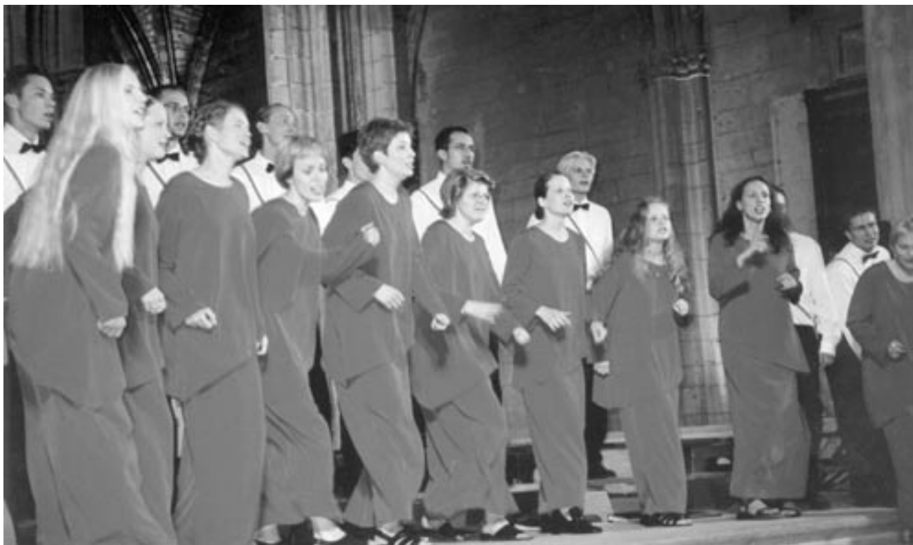
”Vapaat suomalaistytöt” hurmasivat Neversissä etnolaululla, afrotanssilla ja uusilla punaisilla kuoropuvuillaan.