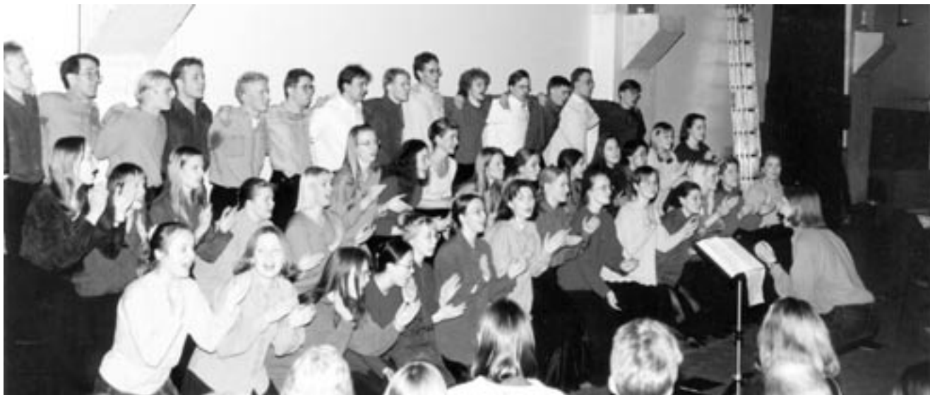
HOL heittäytyy virolaiseen kuorotanssiin Kansa laulaa -konsertissa Kaapelitehtaalla kevättalvella 1996.