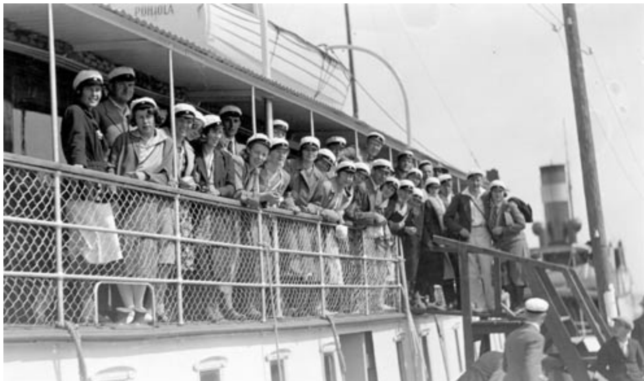
Hämäläisten talon rakennusrahoja kerättiin kotimaakunnasta viihdekiertueilla, joilla ajatus Hämäläis-Osakunnan sekakuorosta syntyi. Hämettä kierrettiin monenlaisilla menopeleillä: HOL sisävesihöyrylaivassa kesäkiertueella 1930.