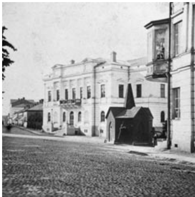
Vuonna 1870 valmistunut Helsingin Vanha ylioppilastalo rakennettiin suurelta osin ylioppilaslaulajien keräämin varoin. Siitä pitäen ylioppilaat ovat laulaneet talossaan, myös hämäläiset, joiden osakuntahuoneisto sijaitsi 1870–90-luvulla ylioppilastalon kellarissa. Kuva on 1880-luvulta.

Ylioppilaskuorojen ohjelmistoon liitettiin jo varhain muutamia suomenkielisiä kansanlauluja. Suomenkielistä laulettavaa alettiin kaivata lisää 1860-luvulla ja kuoro-ohjelmiston kielivalinnoista syntyi kiistoja. Kielitaistelun kuumetessa suomen- ja ruotsinkieliset laulajat eivät enää mahtuneet samaan kuoroon. Suomenmielisen ylioppilasjärjestön Suomalaisen Nuijan yhteyteen syntyi 1876 mieskuoro, joka edelsi 1883 perustettua Ylioppilaskunnan Laulajia. Kielipoliittisesti liberaalit perustivat 1878 Muntra Musikanter-kuoron, joka ensimmäisenä kuorona Suomessa ryhtyi valikoimaan laulajiaan ja sai eliittikuoron leiman.