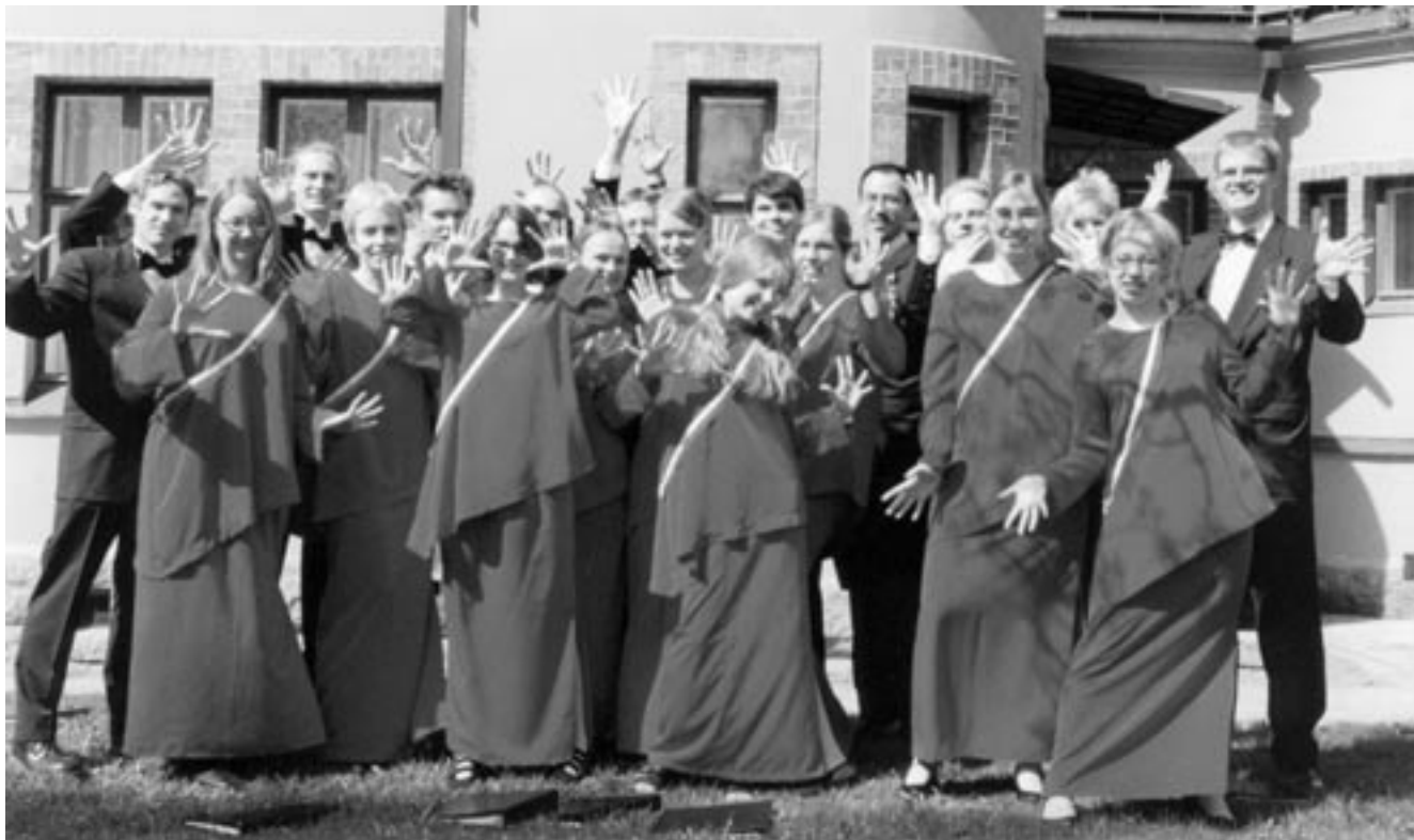
Vaasan kuorofestivaalilla HOL esiintyi menestyksekkäästi pienellä porukalla toukokuussa 2002.