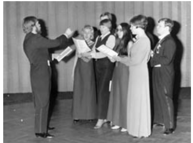
HOLlin yhtye esiintyy tyylikkäästi frakeissa ja iltapuvuissa Pykälä ry:n vuosijuhlassa 1970.

Toista oli entisaika viihdytti vain lauluntaika, kiehtoneet ei hippivaatteet, pyhät oli heimoaatteet, puuttui nuotit pornolauluun, iskusanat marssitauluun. Entäs tänään, Maon opit, Vietnam, pillerit ja tropit. Ennen seksit, kurvit salaa piiloteltiin herkkupalaa, ettei pilais mielialaa aapisena nuottilehti silmäniskuun tuskin ehti; meille riitti olutmukit joulu-, vähän muutkin pukit.