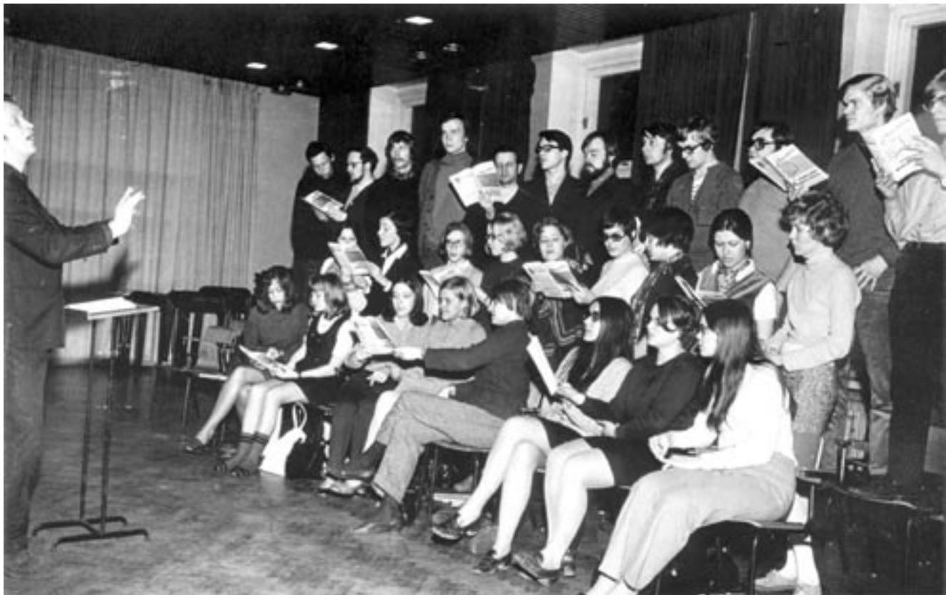
HOL harjoittelee 1970.

Seuraavana keväänä tehtiin pitkästä aikaa kirkkokonserttikiertue Hämeessä, mutta jo syksyllä 1976 alettiin valmistella Puolan-matkaa. Vierailusta sovittiin, matkaohjelmisto harjoiteltiin ja esitettiinkin Helsingissä, mutta kaksi viikkoa ennen lähtöä puolalaiset ilmoittivat lyhyesti sähköitse, että Varsovasta ei löydy yhtäkään vapaata hotellihuonetta ja että vierailu täytyy peruuttaa. Ilmeisen poliittinen yllätyskäänne sapetti, kunnes kesäkuussa kuoro sai kutsun lähteä kahden viikon varoitusajalla Suomen opetusministeriön ja Neuvostoliiton valtion kustannuksella Tallinnaan nuorison laulujuhliille. HOL toivoi virolaista opiskelijakuoroa kumppanikseen yhteiskonserttiin. Neuvostoisännät