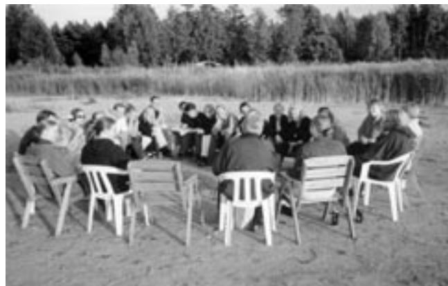
HOL rentoutui Ahvenanmaan ilta-auringossa Alandia Jazz-festivaalin aikaan kesällä 1999.

Projektimainen toiminta kertoo nykyajan opiskelijakuoron lyhytjänteisyydestä: yhteen ideaan jaksetaan keskittyä yhden kauden verran, sitten on saatava vaihtelua. Vaihtelunhalua sekä yksilöllisyyden ja omaperäisyyden kaipuuta ilmentävät myös aktiivisimpien kuorolaisten omat tuotannot ja yhtyeet. Toisaalta samantapaisia nuorekkaita luovuuden purkauksia on HOLlissa nähty jo kuoron huippukausilla 60- ja 80-luvuilla, joten mistään puhtaasta ajanilmiöstä ei liene kysymys vaan pikemmin etevien johtajien luomasta inspiroivasta ilmapiiristä ja viime kädessä yksittäisten kuorolaisten innosta ja lahjoista.