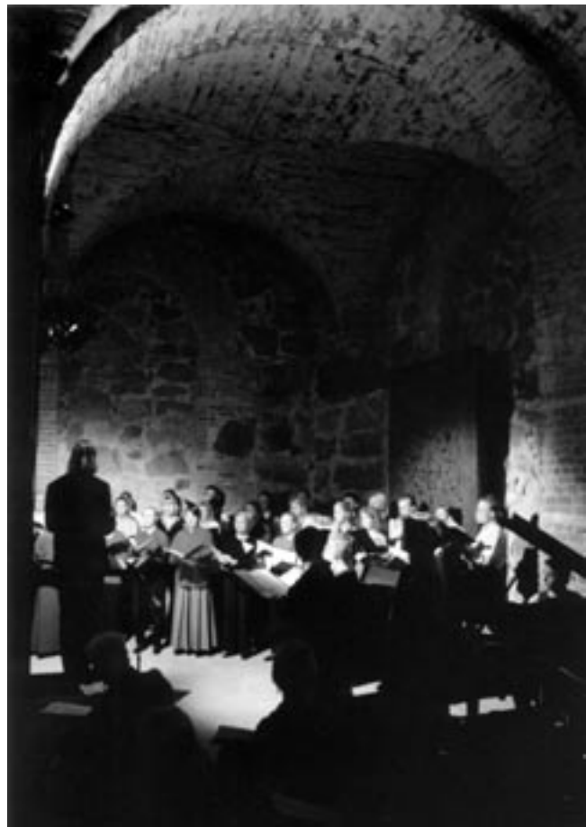
Valo loi vahvan tunnelman Sumujen saaret -konserttiin 1996.

tiin Helsingissä ja Riihimäellä. Tampereella arpaonni ei suostunut, ja HOL sai laulaa Rautavaaran Lähdon, Fougstedtin Stjärnanin, Mäntyjärven Double, Double Toil and Troublen sekä Kuusiston sovittaman Illan viimeisen tangon klo 10 aamulla. Tulos oli heikko: kaksi hopealeimaa. Kuoroa kiitettiin hyvin harjoitetuksi ja sydäimestä laulavaksi, oli nuorekasta sointia ja kvali-teettia. Tuomaristo kaipasi kuitenkin vaativaan ohjelmaan intensiteettiä ja legatolinjaa, tonaalinen romahduskin uhkasi. Tangon huipennus, kuorokaavusta kuoriutuneen kukkamekkoisen alton ja enkelikiharaisen