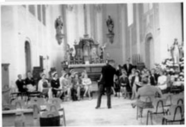
Kuvia HOLlin ensimmäiseltä ulkomaanmatkalta 1964: harjoitukset Lauingenin kirkossa, jäähyväiset Münchenin rautatieasemalla, puheenjohtaja ojentaa osakunnan standaarin Wienin pormestarille ja iloinen ilta Heurigen-viinituovassa.