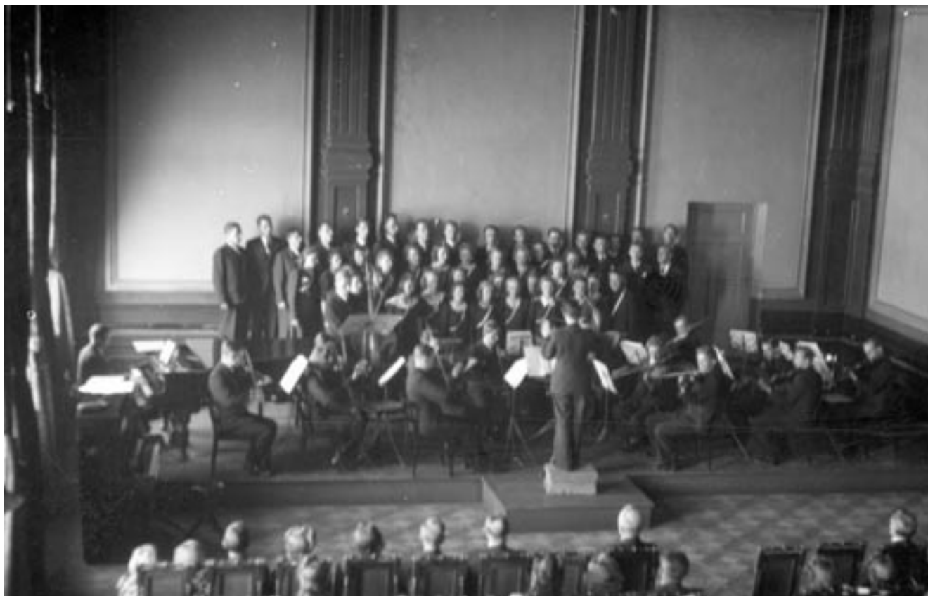
HOL ja HOS tekivät ensimmäisen sodanjälkeisen konserttimatkansa 1946 Hämeenlinnaan.