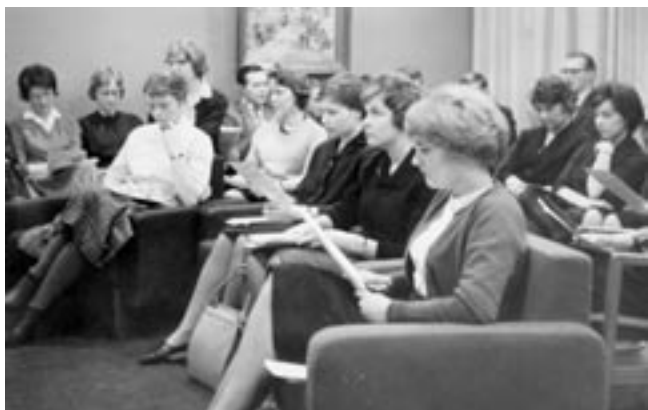
Keskittynyttä harjoittelua keväällä 1961.

jonka radikaaliin kulttuurikäsitteeseen osakunnan toudut eivät mahtuneet. Lehden musiikkiartikkelit käsittelivät avantgardea, Stockhausenia ja Cagea.