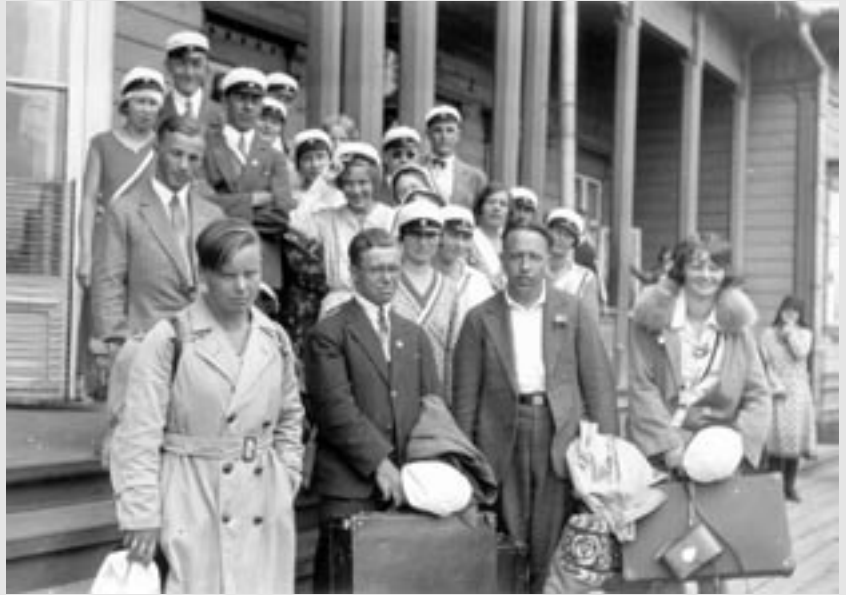
Martti Turunen ja hollilaiset asemalla HOLlin ensimmäisellä kesäkiertueella 1930.

Turusen maineen kuoronjohtajana loivat YL:n menestyksekkäät kiertueet Euroopassa 1935 ja Yhdysvalloissa 1937–38. Kun Turunen sai 1946 Suomen Laulun johdettavakseen, hän saavutti Klemetin aseman Suomen kuoroelämän johtohahmona. Hänen uransa huipensivat 1953 YL:n toinen Amerikan-matka ja Suomen Laulun Bachin h-mollin messun esitys Pariisin Madeleine-kirkossa.