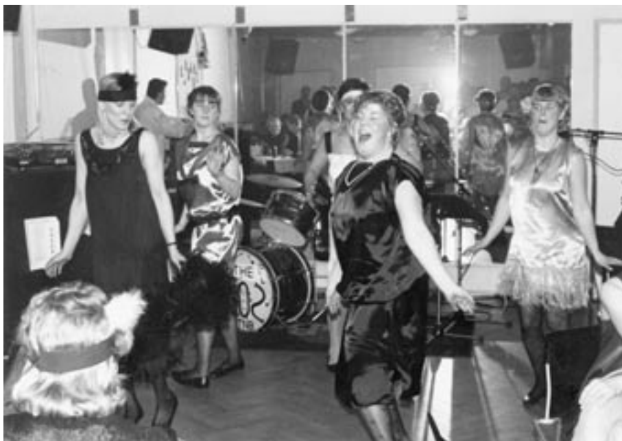
Cotton Club -teemabileet 1988 nostivat kuorolaisten monet kyvyt esiin.

puvut ovat vakiintuneet HOLlin tunnusmerkiksi, eikä punaväristä raaskittu luopua seuraavassakaan puku-uudistuksessa 1999. Uusissa puvuissa kelpasi laulaa keväällä Hausjärven kirkossa iltamusiikkia: Palestrinaa, Schütziä, Bachia, Lisztiä, Bardosta ja kotimaista hengellistä. Toukokuussa kirkkomusiikkiohjelmaa täydennettiin Bachin kantaatilla ”Aus der Tiefe rufe ich zu dir”, joka esitettiin soitinyhtyeen säestyksellä Kannelmäen ja Temppeliaukion kirkoissa.