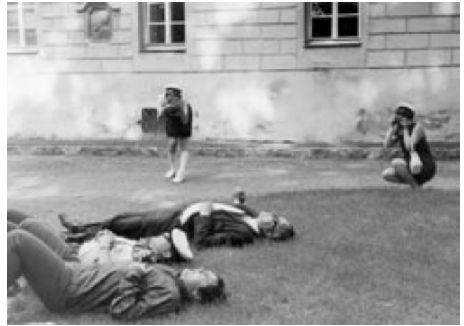
Lepohetki Welsissä Itävallassa 1969.

Kaukokaipuu heräsi, ja alettiin puuhata Itävalan-matkaa kesäksi 1969. Hanke veti laulajia kuoroon. Tenorin, HOL 1969–77, opiskelutoveri mainosti: ”Lähde jätkä nyt mukaan, Herran jestas, siellä on naisia ja viinaa”. Ohjelmassa oli myös kesäseminaari Ylä-Itävallan musiikkiopistossa Grieskirchenissä, konsertit Welsissä, Tollet’n linnassa ja Bad Schallerbachissa sekä epävirallista laulantaa viinituvissa ja asemilla. Matka-elämyksiä jaettiin osakunnan vuosikirjassa: Itävaltalaiset valloittivat meidät joka paikassa välittömyydellään ja ystävällisyydellään. Oli sykhdyttävää nähdä, millä tavalla he ottivat vastaan meidän laulumme. Aplodeista ei ollut tulla loppua ja kuvitelkaapa – konserttiyleisö seisoi Welsissä konserttitalon portailla laulamassa jäähyväi-