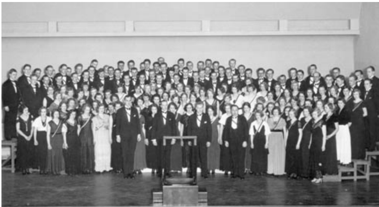
Viisi nuorta osakuntakuoroa pitivät yhteiset konserttitanssiaiset Konservatoriossa keväällä 1933.