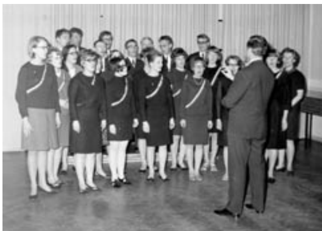
HOL esiintyi 1970-luvulle asti päivätilaisuuksissa yleensä pikkumustissa ja kokopuvuissa. Kuva on vuodelta 1967.

Ensimmäisen ulkomaanmatkan jälkeen HOLlin taiteellinen toiminta sai vakiintuneita muotoja. Syksyllä ja talvella esiinnyttiin muutamien lauluin osakunnan juhlissa (usein koko kuoron voimin) sekä joissakin ulkopuolisissa tilaisuuksissa. Monet esiintymistilaisuudet olivat hengellisiä niin osakunnan ja yliopiston piirissä kuin ulkopuolellakin. HOL esitti ohjelmistoaan säännöllisesti myös osakunnan teeilloissa ja tarjosi osakuntalaisille kokeeksi myös yökonsertteja. Lauluvuosi huipentui keväällä konserttikiertueeseen Hämeessä, jossa laulettiin yleensä kouluissa ja kirkkoissa. Ohjelmistoon otettiin laajoja ja vaikeitakin kirkkomusiikkiteoksia, joista muutamat vaativat soitinsäestystä. Näistä mainittakoon J. S. Bachin motetti ”Lobet den Herrn, alle Heiden” ja kantaatti Actus tragicus, Christopher Graupnerin kantaatti ”Niin suur’ on tuskas aivan” ja Henry Purcellin ”Riemuitkaa Herralle”. Kiertueilla esiinnyttiin usein HOSsin kanssa.