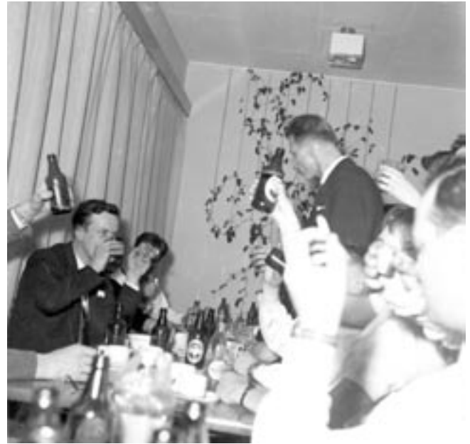
Olut maistui hyvin HOLin miehille 1959, naisille varsin huonosti vielä tähän aikaan.