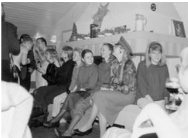
Osakunnan uudesta saunasta tuli 1980-luvun lopussa kuoron juhlien vakiopaikka. Kuvassa pikkujoulut 1990.

Kevätkonsertti pidettiin Jokioisilla. Kesällä HOL matkusti ensi kerran Viroon luomaan suhteita Tarton yliopiston kamarikuoroon. Hämäläis-Osakunta elvytti muiden osakuntien tavoin vanhat Viron-suhteensa