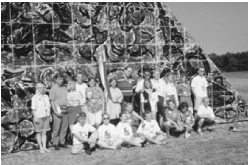
HOL raukeana pidettyään konsertin pätsiksi lämmenneessä taidemuseossa Europa Cantat -festivaalilla Herningissä 1994.