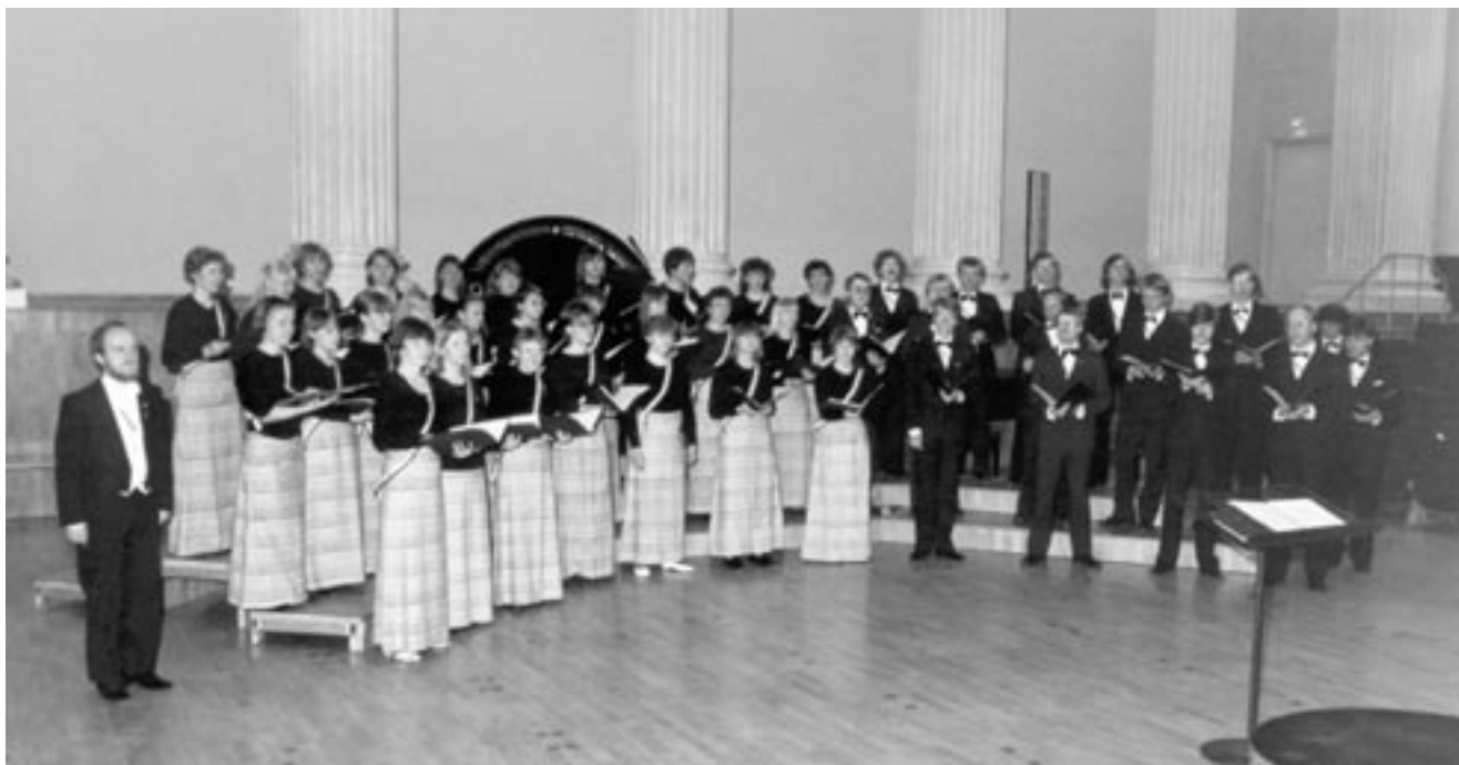
HOLLin naisille luotiin ensimmäinen yhtenäinen kuoropuku 1970-luvun lopulla. Maksihameessa ja Marimekko-kuosissa esiinnyttiin myös 55-vuotisjuhlakonsertissa 1984.

tavoittelu johtanut jonkinasteiseen keinovarojen kaventumiseen ja tunteitten karsinoimiseen?”