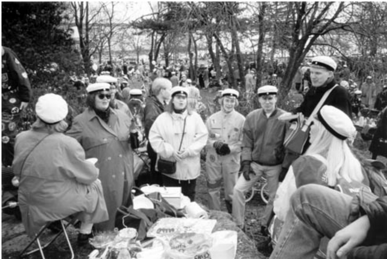
HOL on aina viettänyt vappua yhdessä. Piknik Ullanlinnanmäellä vakiopaikassa vakiintui tavaksi 1980-luvulla. Tässä herkutellaan koleana vappuna 1995.

kohtaan haihtui ja porukka alkoi pistellä ihan surutta kaikki uudet biisit ihan suoraan läpi ensi lukemalta. Toki täytyy myöntää, että valtaosalla oli aika hyvät pohjatiedot ja -taidot tällaiseen.