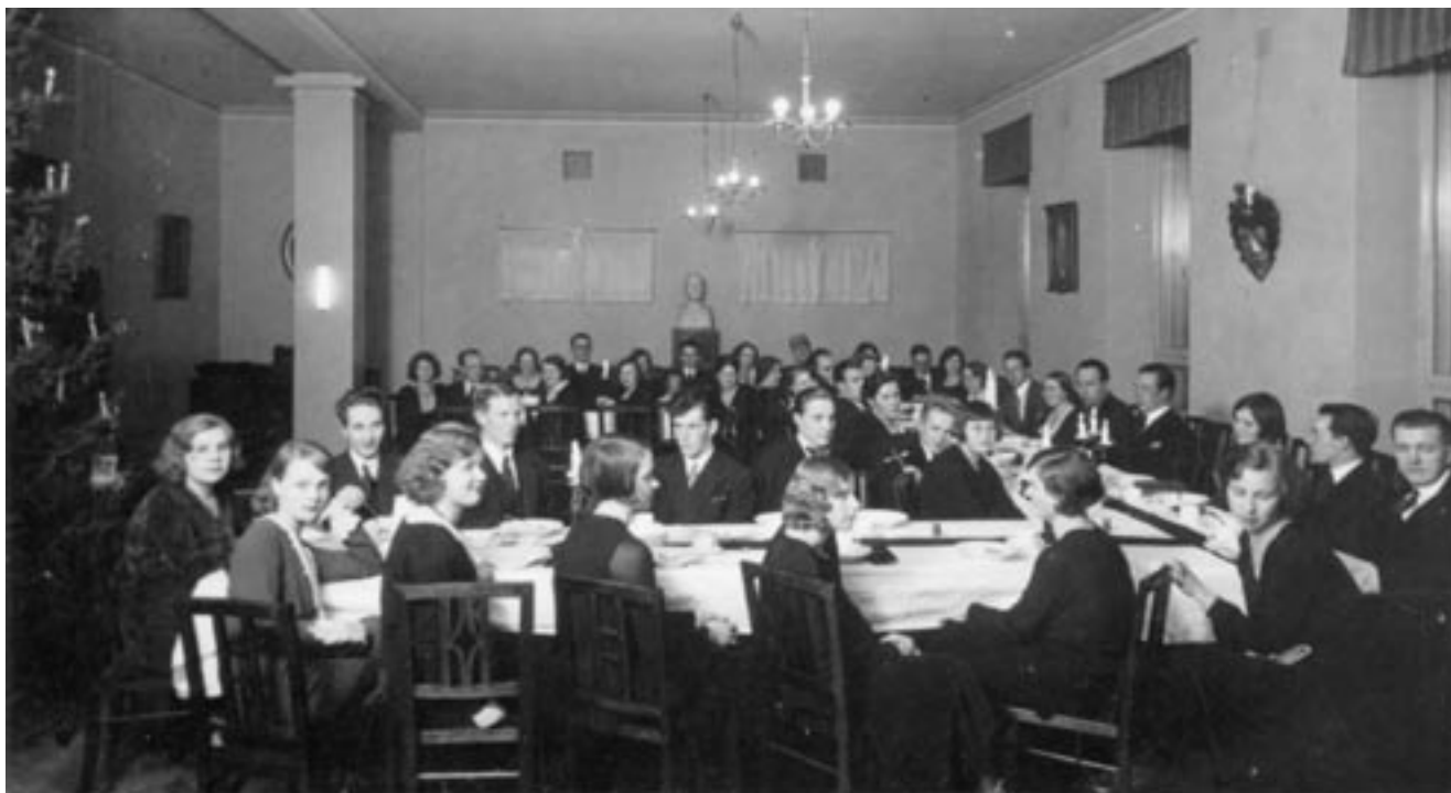
HOL vietti 1931 pikkujoulua ensi kertaa upouudessa Hämäläisten talossa.

sille ylioppilastyöille ja -pojille – pidettiinpä puuron-syöntikilpailujakin, kertoo sopraano, HOL 1931–39.