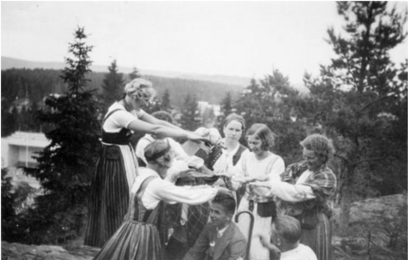
Kansallisromantiikkaa: tytöt antavat laulumerkin suorittaneelle tenorille HOL-kasteen Sortavalan laulujuhilla vuonna 1935. Taustalla vasemmalla häämöttää laululava.

Menestys innosti jatkamaan yhteistyötä samoilla linjoilla. Kevätlukukaudella 1935 HOS järjesti osakunnassa wieniläisillan, jossa jälleen esitettiin "Mustalaiselämää", mutta sen lisäksi Holli harjoitteli yhdessä Hossin kanssa esityskuntoon Straussin "Wienerblut"-teoksen. Sen hyväksi tehtiin lujasti työtä, pidettiin ylimääräisiäkin