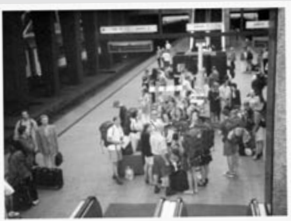
Ikimuistoinen junamatka Puolan tulvien halki vei hollilaiset Linzin Europa Cantat -festivaalille 1997.

Tästä on todisteena se, että nörttiklubin lempimatkakohteeksi on yllättäen kivunnut paatuneen rikollisuuden, mafiosojen, luun ja veren Itä-Eurooppa! Jo kahtena vuonna peräkkäin ovat nörtit suunnanneet pahamaineisilla junilla Tallinnasta etelään, Latvian ja Liettuan halki Puolaan ja tänä vuonna vielä Tshekkiin ja Slovakiaan asti. Varmistaakseen