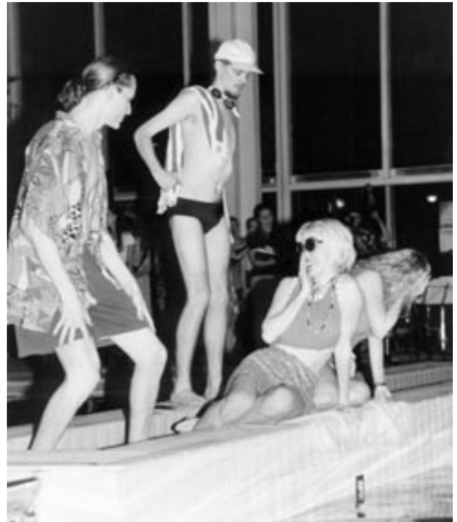
Rantaleijonia ja turistipimuja Välimeri-konsertissa 1998.