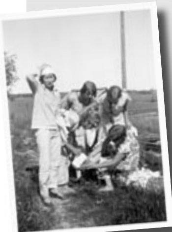
HOLlin ensimmäisellä kesäkiertueella käytiin kaivolla aamupesulla ja ehdittiin vielä uimaankin.