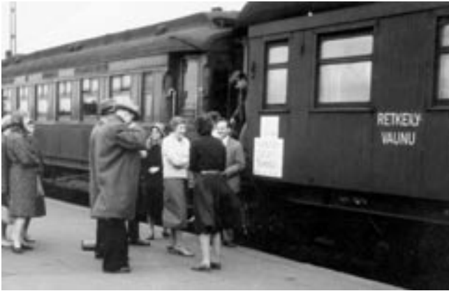
HOLlin retkeilyvaunu kiertueella 1959.

oli tärkeä osa juuri Martilla, joka oli silloin 30-vuotias, erittäin charmantti ja myös tietoinen omasta viehätysvoimastaan. Mutta samalla hän oli mainio johtaja, innostava ja nuorena ihmisenä usein, varsinkin matkoilla kuin yksi kuorolaisista, luonnehtii sopraano, HOL 1961–64.