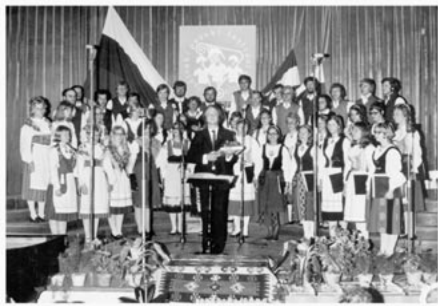
Kansallispuvuissa konsertoiminen oli hikistä puuhaa Jugoslavian-matkalla 1971.

Laulajien Jugoslavian matkan päätarkoitus oli osallistua Celjen suurille musiikkifestivaaleille. Siellä se piti yhteiskonsertin unkarilaisen nuorisokuoron ja Jugoslavian parhaan nuorten kuoron kanssa. Myös tšhekkoslovakialaiset oli kutsuttu, mutta heidän matkansa estyi viime hetkessä.