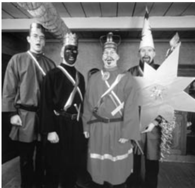
HOL-tiernapojat osakuntajihänkeineen ovat laulaneet Ruiskumestarin talossa Kristianinkadulla vuodesta 1996 lähtien.

HOLlin sosiaalinen elämä heijasti 1990-luvulla kuoron taiteellista kehitystä – innostava ilmapiiri näkyi usein myös kaikenlaisen viihteellisen luovuuden vilkastumisena. Parhaimmillaan hollilaisten kalenterit täyttyivät harjoitusten ja harjoituksenjälkeisten, leirien, konserttien, keikkojen ja vuotuisjuhlien lisäksi sauna-illoista ja kotibileiden kirjosta. Kesälläkään kuorolaiset eivät yleensä malttaneet pysyä erillään, vaan tapasivat säännöllisesti kapakassa ja mökkiretkillä (ja aivan viime vuosina jopa urheilukentällä). Festivaalimatkat olivat luonnollisesti kesäviihteen huipentumia.