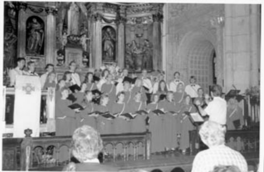
Vitorian Europa Cantat -festivaalilla 1991 ehdittiin pitää konsertti, harjoitella ateljeessa ja pitää hauskaakin ennen epidemian puhkeamista.