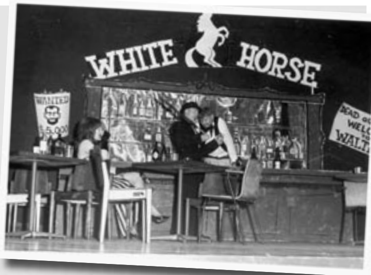
Opera bluffa ”White Horse” oli suuri menestys osakunnan teeillassa 1964.