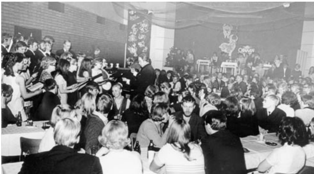
HOL esiintyy Oinaan yössä 1970.

lujitti kuoron ydinjoukkoa entisestään. Tyttöjen asuntola jäi lyhytikäiseksi, mutta poikien kämpppä toimi 1970-luvulle asti.