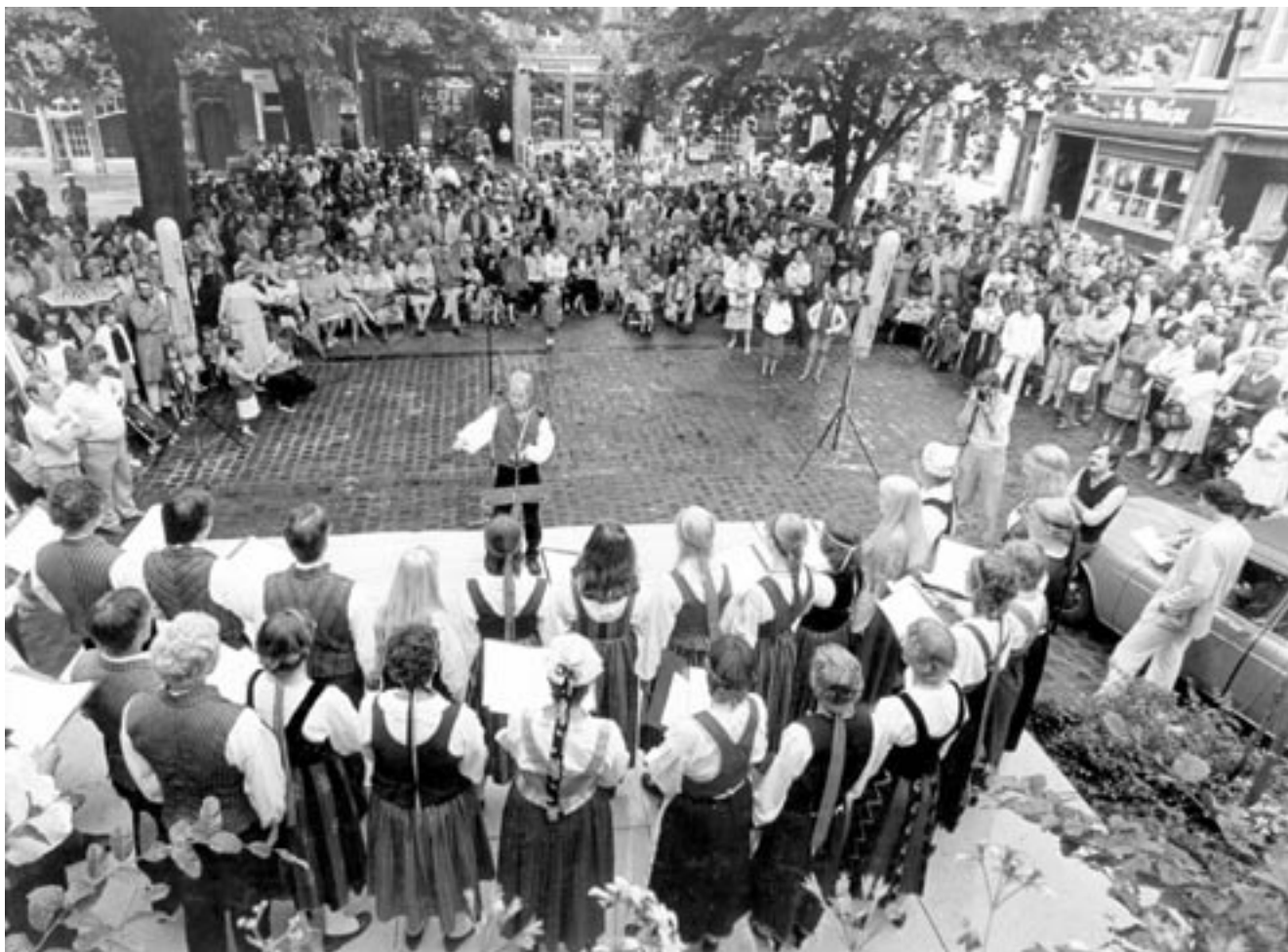
Klasu johtaa ja HOL laulaa kansallispuvuissaan Namurin torilla Europa Cantat -festivaalilla 1982.