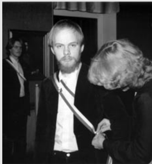
Klasu osakunnan vuosijuhlassa 1982.

Klasu on aina nauttinut kuoro- ja yhtyelaulumusiikista sekä niiden tuomista musiikillisista ja täysin epämusiikillisista tilanteista. Niinpä hän on laulanut 15 kuorossa (muun muassa Hämmäläis-Osakunnan Laulajat, Eteläsuomalaisen Osakunnan Laulajat, Cantemus, Cantabile, Klemetti-Opiston Kamarikuoro, Suomalainen kamarikuoro, Lahden Kamarikuoro) ja neljässä lauluyhtyeessä, johtanut 14 kuoroa (muun muassa Hämmäläis-Osakunnan Laulajat, Lahden Kamarikuoro, Kuhmoisten Sekakuoro), toiminut viiden kuoron varajohtajana sekä opettanut kuoronjohtoa ja kuorolaulua lähinnä erilaisilla viikonloppukursseilla.