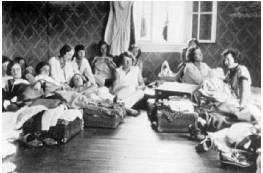
Kuoromatkoiilla syntyy muistoja: HOLlin tyttöjen huone maatalon yläkerrassa kesäkiertueella 1932.